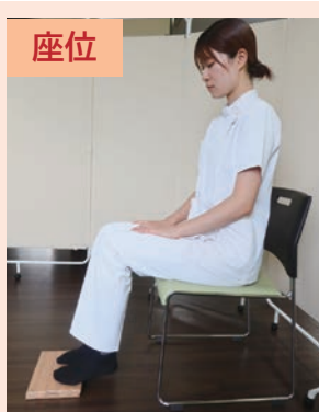
椅子に座って実施