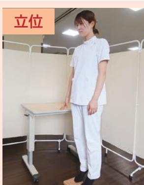
テーブルや手すりなど、支えになるものがある場所で実施